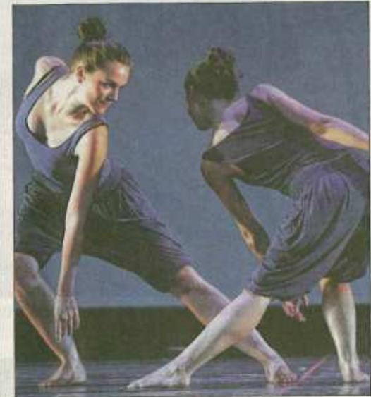
Anmut und Schönheit im Tanz ...

Die öffentlichen Auftritte sind immer das „Salz in der Suppe“ im Schuljahr der Theaterballettschule. Und da stehen einige ungewöhnliche Veranstaltungen auf dem Programm. „Wir werden beispielsweise in der Gedenkstätte am Moritzhof eine spezielle Choreographie tanzen und bereiten im Augenblick ein Programm im Technikmuseum vor. Das wird schon sehr ungewöhnlich und sehr spannend“, freut sich die